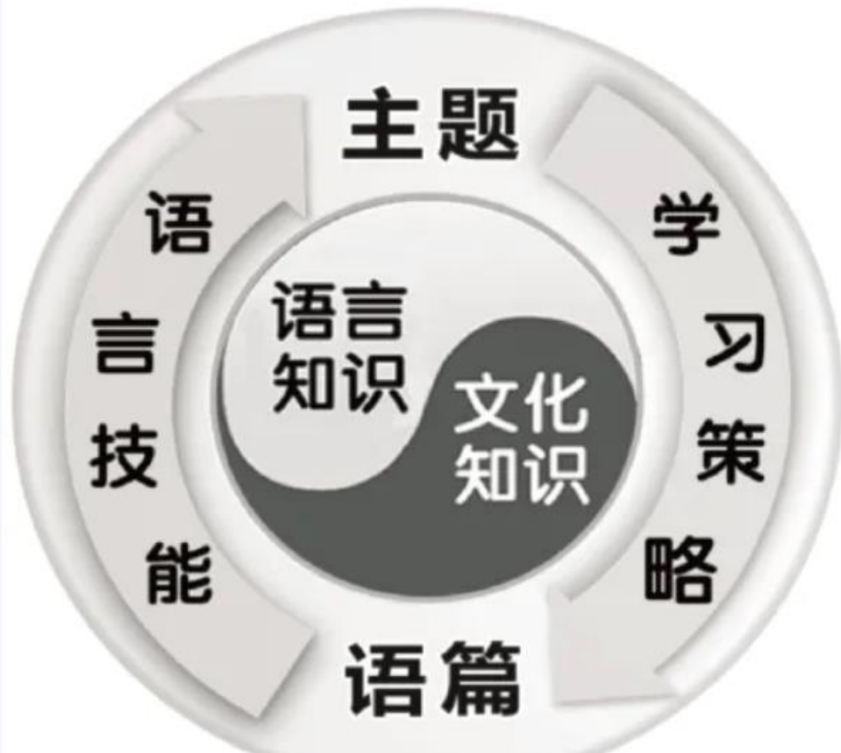
六要素整合的英语课程内容图示

不同的语篇类型为学生接触真实社会中丰富的语篇形式提供了机会，也为教师组织多样的课堂学习活动提供了素材--《课标》p18页