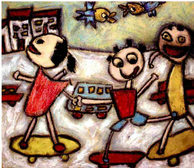
《滑冰的快乐》 肖烨坤 (指导教师:钱晓萍)