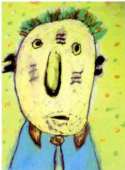
《我的爷爷》 夏启杰 (指导教师:冯晓薇)