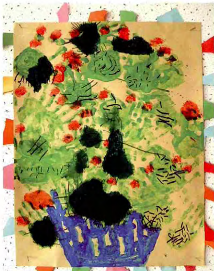
《仙人掌》 杨 晖 (指导教师:凡 梅)